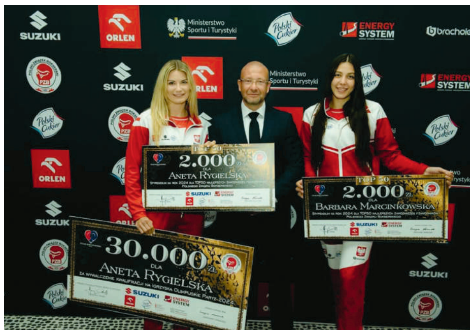
Gala wręczenia stypendiów sportowych TOP 50 dla najzdolniejszych pięściarek i pięściarzy na rok 2024