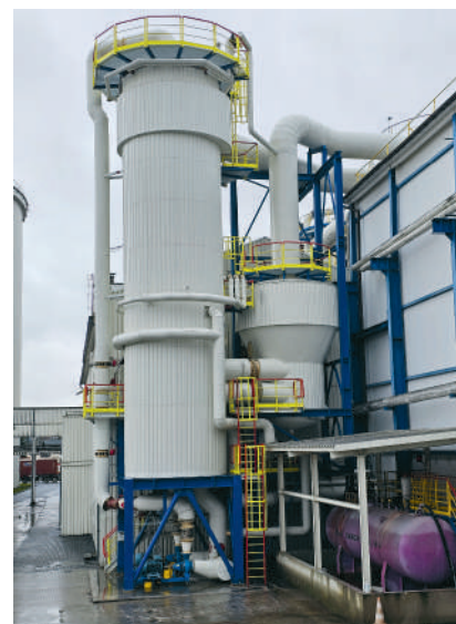
Modernizacja gospodarki ciepłej Cukrownia Kruszwica

Utrzymanie najwyższych standardów realizowanych prac zapewniają wdrożone systemy zarządzania wg norm PN-EN ISO 9001, 14001 i 45001 (zintegrowany system zarządza-